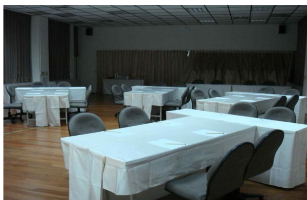
公民咖啡館教室 B 場次 (R103, 可容納 50 人)