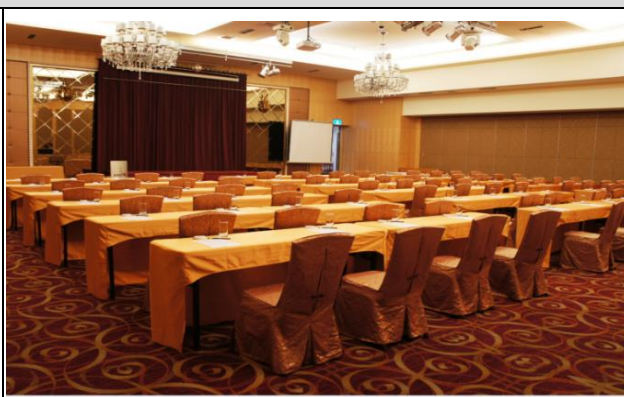
主論壇場地 國際會議廳二廳 (可容納 150 人)