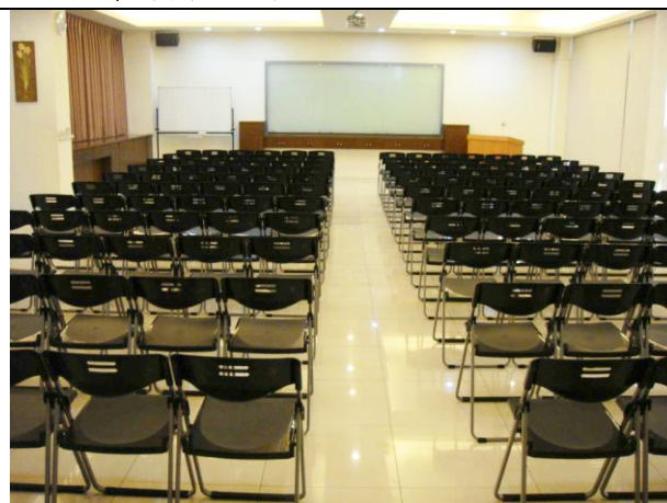
【文化创意產業】專題演講 (R102, 可容納 100 人)