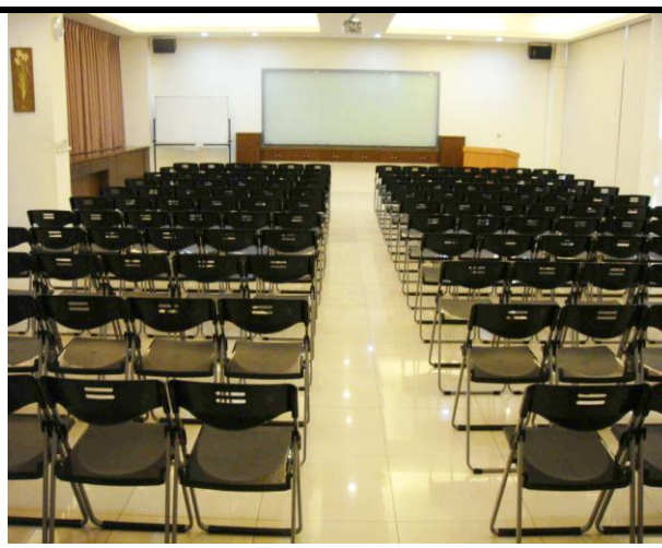
公民咖啡館教室 C、D 場次 (R102, 可容納 100 人)