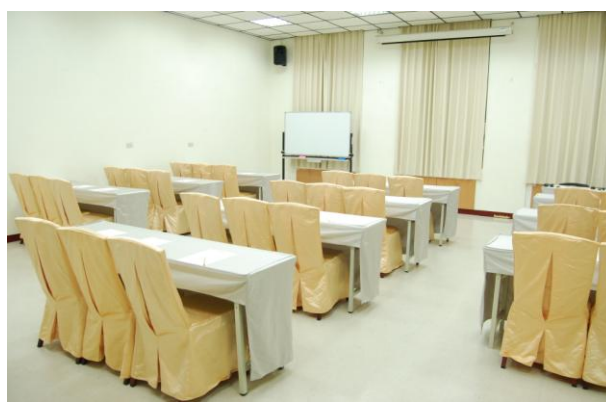
公民咖啡館教室 E 場次 (R107, 可容納 50 人)